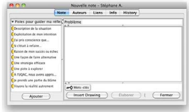
Figure 1. Balises proposées pour guider la réflexion des participants sur le forum électronique

mises à l'essai dans d'autres contextes de formation à l'enseignement (Allaire, 2006; Allaire et Hamel, 2009).