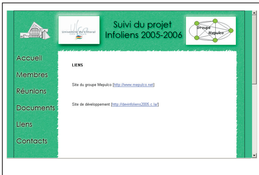
Figure 2. Exemple de page d'un site de suivi de projet

En complément des réunions d'équipes, le principal vecteur de communication et